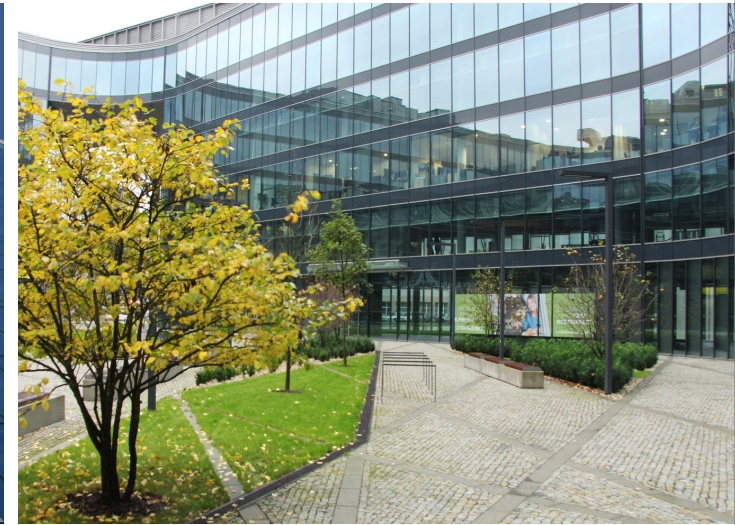
CZECH REPUBLIC OSTRAVA, NOVÁ KAROLINA PARK OSTRAVA - STRATOBEL STOPRAY 66.2 AND STRATOBEL STOPRAY 66.2 - CMC ARCHITECTS - BREEAM VERY GOOD

Para más información consulte el informe anual de sostenibilidad de AGC en www.agc-glass.eu/en/sustainability o envíe sus preguntas y/o sugerencias por correo electrónico al departamento Sustainability & Product Stewardship en sustainability@eu.agc.com .