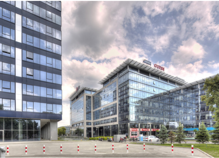
POLONIA VARSOVIA, MOKOTÓW NOVA - STOPRAY VISION-50 SOBRE CLEARVISION Y STOPRAY VISION-50T - JASPERS-EYERS - BREEAM VERY GOOD